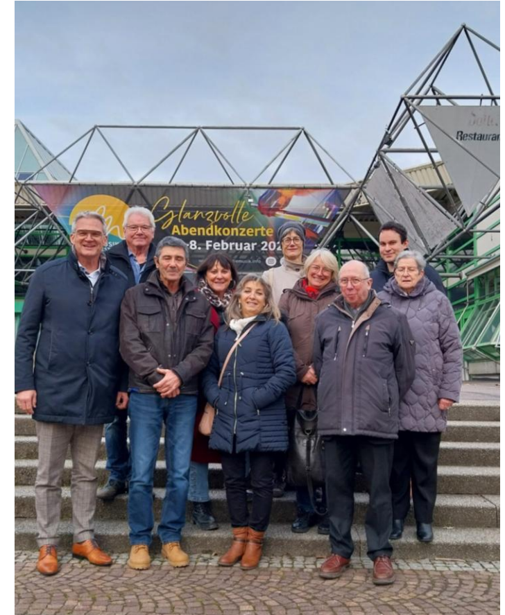
Foto: Delegation aus Carmaux in Neckarsulm

Im Mittelpunkt des Aufenthalts stand der Besuch verschiedener Konzerte, ein Besuch der langen Nacht der Mediathek und eine Werksführung der Audi AG – Produktion.